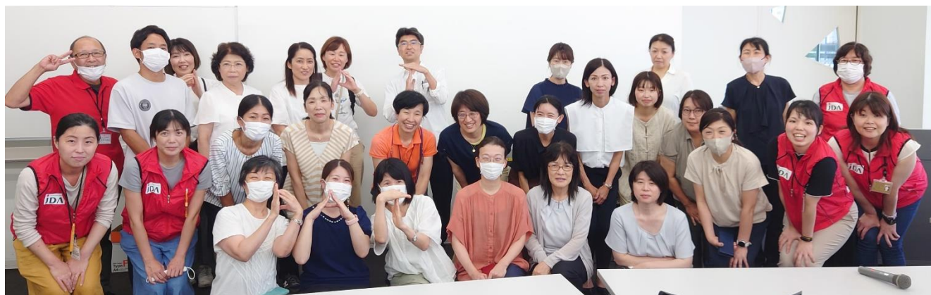
解散前に参加者全員で記念撮影。赤いジャンパー着用者はJDA-DATリーダー。

今回の経験を活かし、さらにバージョンアップした研修開催を目指します。災害支援・受援に関心をお持ちの方は、是非、次の機会にご参加ください！！