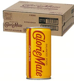
カロリーメイト リキッド カフェオレ味