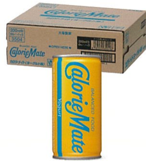
カロリーメイト リキッド ヨーグルト味