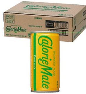
カロリーメイト リキッド フルーツミックス味