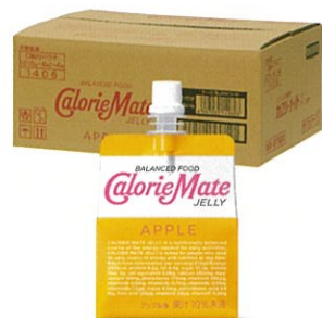
カロリーメイト ゼリー アップル味