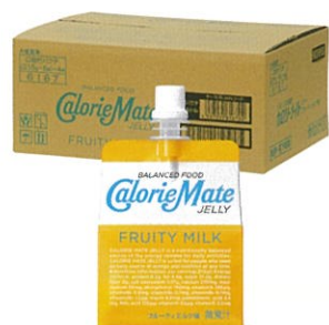
カロリーメイト ゼリー フルーティミルク味