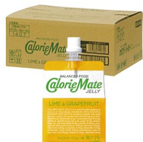
カロリーメイト ゼリー ライム&グレープフルーツ味