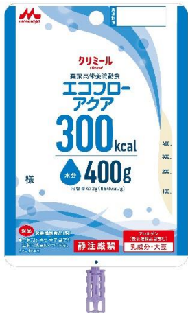
エコフローアクア 300kcal