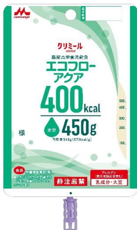
エコフローアクア 400kcal

エコフローアクアは900kcal を標準的な摂取量とする、 高栄養流動食(とろみ状)です。