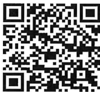
【リエイブルメントチラシ QRコード】